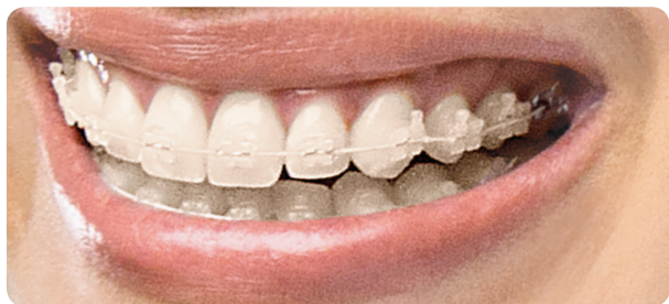
配上牙色弓丝，您的托槽几乎隐形。

ClearVu的设计不仅能及时有效的矫正牙齿，同时提供最舒适美观的托槽。选择ClearVu意味着在整个治疗过程中，人们只会关注您的笑容而不是托槽。